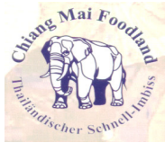
ร้านเชียงใหม่