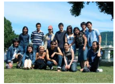
Aktivität: Briefeschreiben nach Thailand & Neckarfahrt, Juni 2004