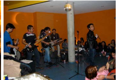
„Borijak“ Benefizkonzert & Auktion, Februar 2005